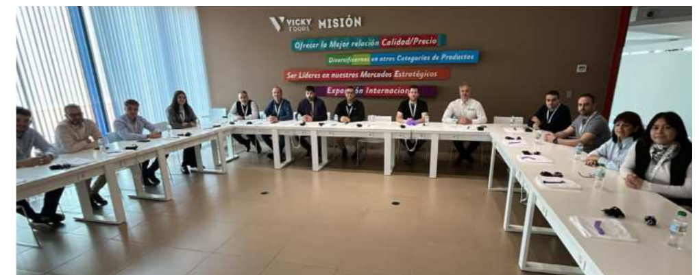
Visitas de los alumnos del máster a distintas empresas y una de las clases.

sus procesos. El perfil de los participantes abarca directivos, mandos intermedios, responsables de innovación, consultores o emprendedores tecnológicos. Hasta la fecha, se han formado profesionales pertenecientes a más de 100 compañías de variados sectores, entre ellas Telefónica, Michelin, Florette, ABB, Ford, Pamesa, IVECO, FERMAX, Nestlé o TDK.