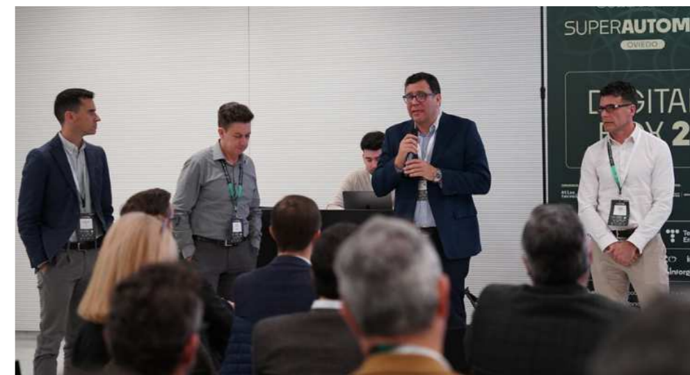
Reunión final de todos los participantes en la segunda sesión del Digital Box 2.