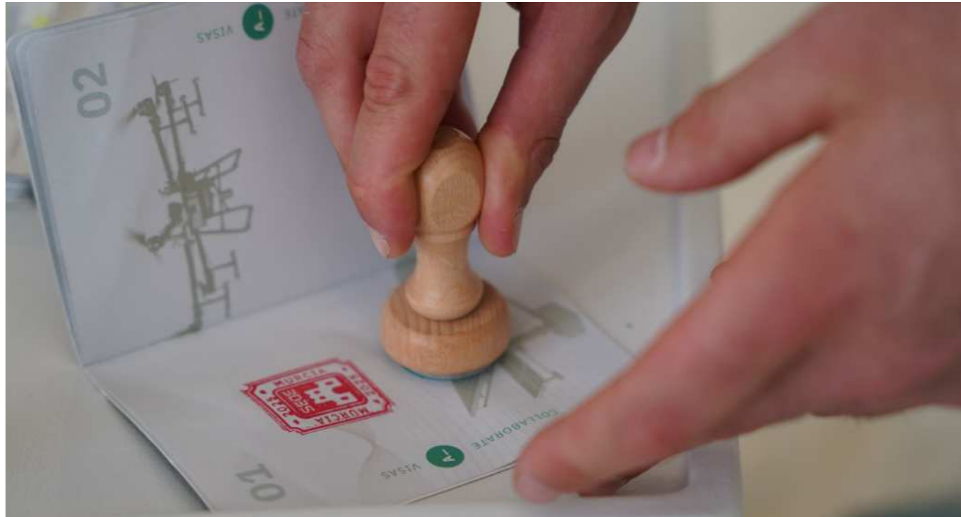
Un asistente cuña su Pasaporte Collaborate en la edición celebrada en Oviedo.